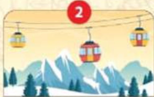
गौरीकुण्ड-केदारनाथ, गोविंदघाट-हेमकुंड साहिब रोपवे।