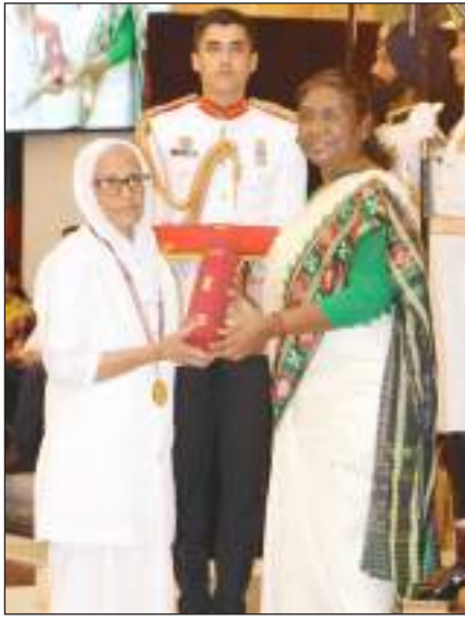
राष्ट्रपति द्रौपदी मुर्मू ने नर्सिंग पेशेवरों को राष्ट्रीय फ्लोरेस नाइटिंगेल पुरस्कार प्रदान किए।