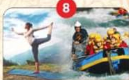
एडवेंचर टूरिज्म व योग का केन्द्र बना उत्तराखण्ड।