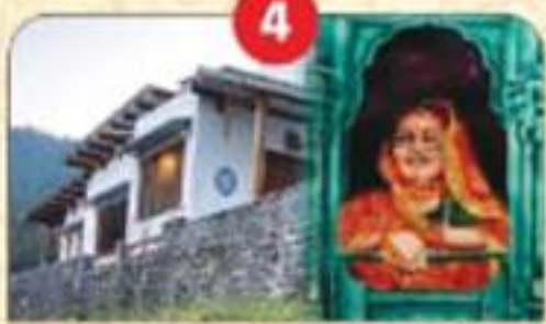
4000 से अधिक होम स्टे विकसित।