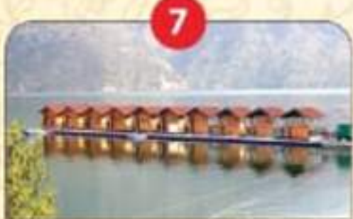
2 हजार करोड़ रुपए की लागत से टिहरी लेक डेवलेपमेंट।