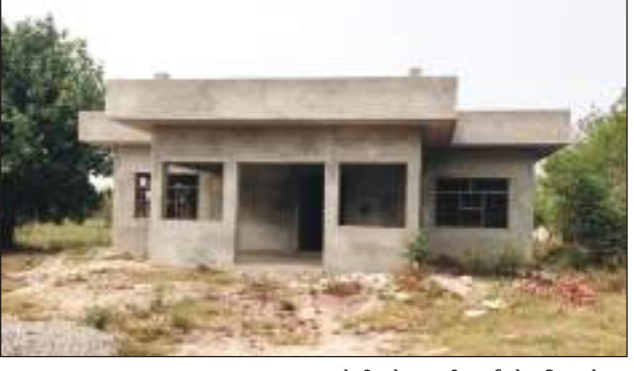
छोटी लैब में सभी परीक्षण नहीं हो पा रहे, अतीरिक्त समय मांगा है।

टीम एक्शन इंडिया/गन्नौर। क्षेत्र में सप्लाई हो रहे पीने के पानी की शुद्धता जांचने के लिए वादशाही रोड स्थित जलघर में लैब का निर्माण किया जा रहा है। लैब बनाने पर करीब 70 लाख रुपये की राशि खर्च होने हैं, लेकिन करीब डेढ़ साल बीत जाने बाद भी लैब का निर्माण अभी तक पूरा नहीं हो पाया है। एजेंसी ने लैब के निर्माण के लिए छह महीने का और समय मांगा है। जिसके चलते अब लैब निर्माण में अभी छह माह का और समय लगेगा। लैब का निर्माण पूरा होने के बाद इसमें पानी की जांच शुरू हो जाएगी।