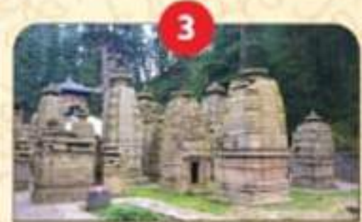
मानसखण्ड मंदिर माला मिशन।