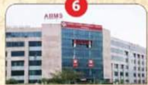
AIIMS, ऋषिकेश का उधमसिंहनगर में सैटेलाइट सेंटर।