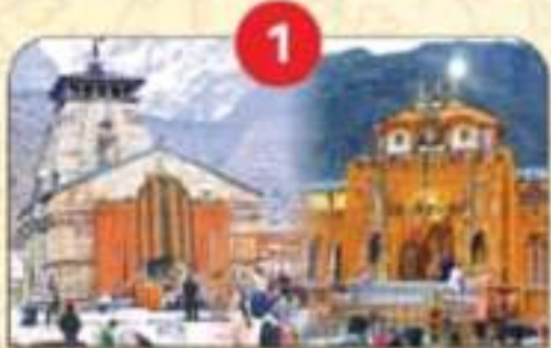
केदारनाथ-बद्रीनाथ धाम में 1300 करोड़ रुपए से पुनर्निर्माण का कार्य।