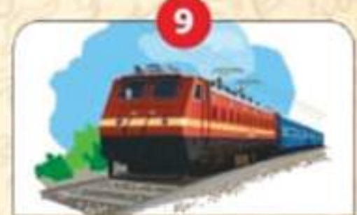
टनकपुर-बागेश्वर रेल लाइन का विकास।