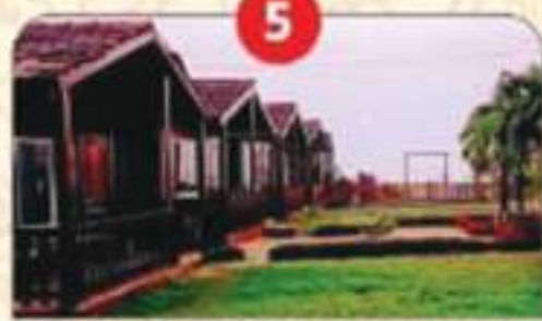
16 ईको टूरिज्म डेस्टिनेशन का विकास।